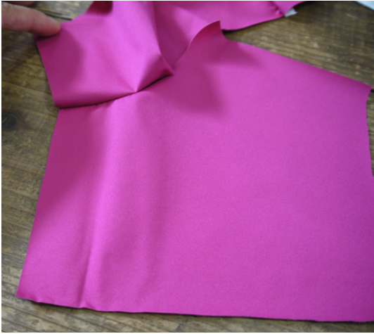
6：前身頃とフードの印の所迄縫い合わせます。