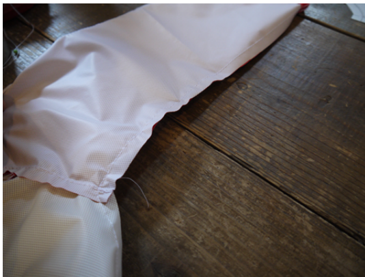
18：袖下から脇にかけてを中縫いします。