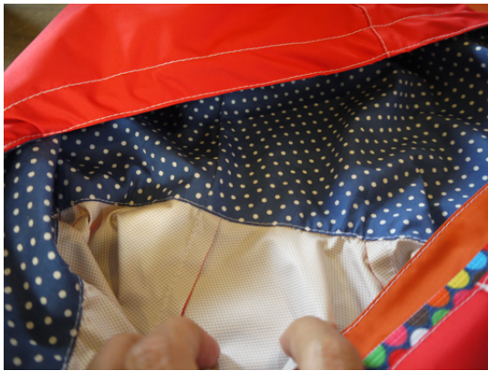
16：フード裏を折り込みながら襟ぐりにコバステッチで縫いとめます。フード付けの完成。