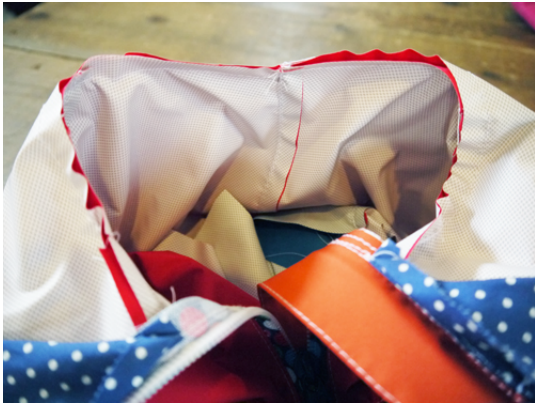
15：身頃にフードを縫い付けます。