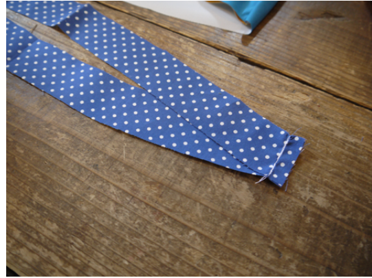
21：見返しの両脇を縫います。