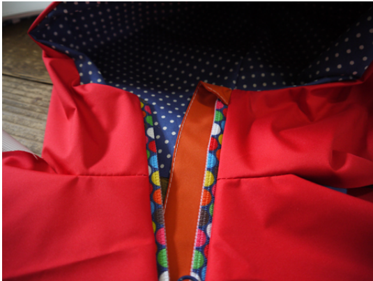
ファスナーが付きました。