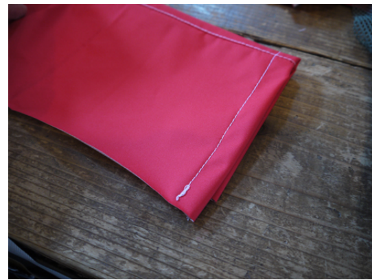
17：袖口を3つ折りにしてステッチをかけます。