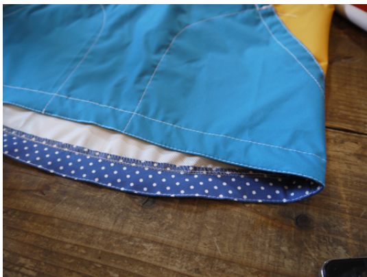
24：見返しをかえしてダブルステッチで出来上がり！