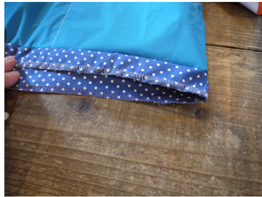
23：身返しにロック始末、（付ける前でも OK）