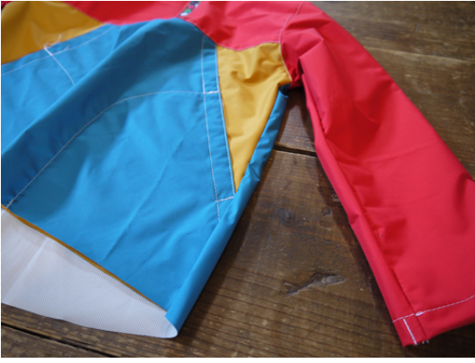
20：表にかえすとこんな感じ。