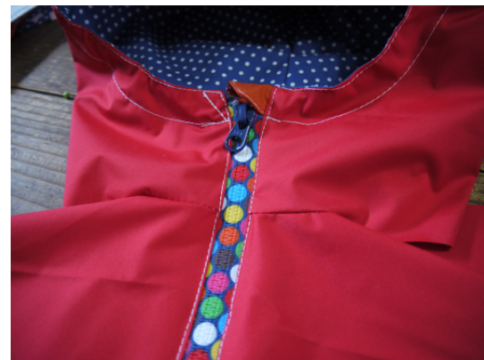
9：ファスナー付け部分からフード迄ぐるりとステッチをします。