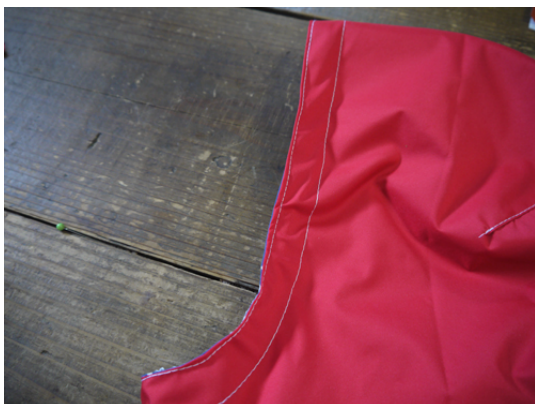
フードはダブルステッチです。