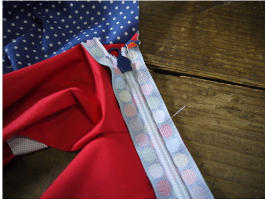
8：ファスナー付け。 前身頃上とフード部分にファスナーを縫い付けます。