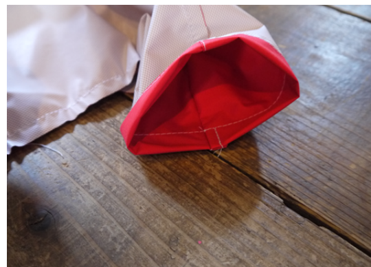
19：袖口の縫い代をステッチで押さえます。