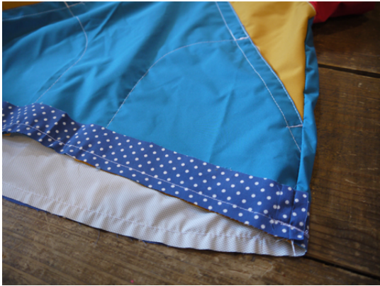
22：見返しと身頃を縫い合わせます。