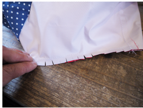
縫ったら縫い代に切り込みを入れます。