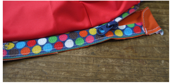
7：ファスナー付け。 前立てにファスナーを仮止めします。